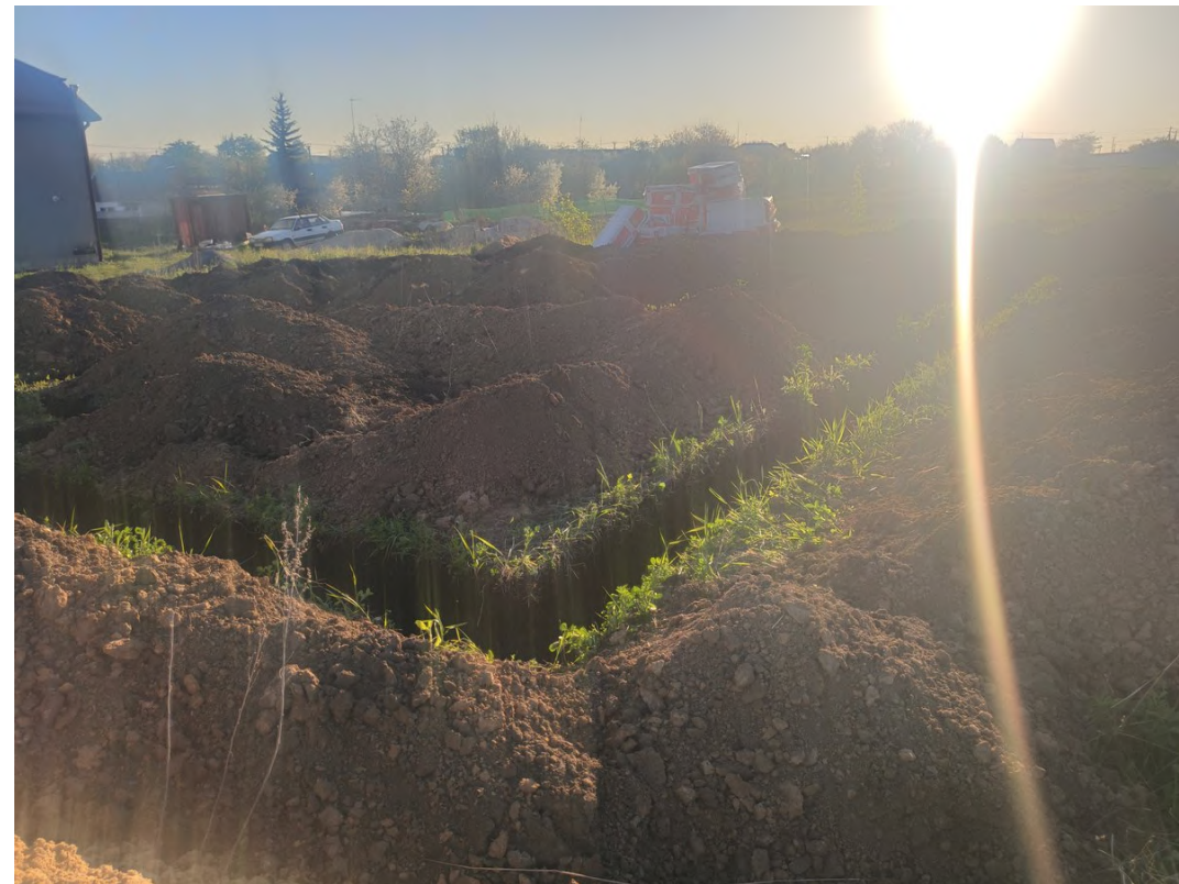
1. Солнечный блик полностью засветил кадр, линия горизонта находится слишком высоко, камера наклонена.

Внимательно рассмотрите примеры и учитывайте эти ошибки при подготовке фото