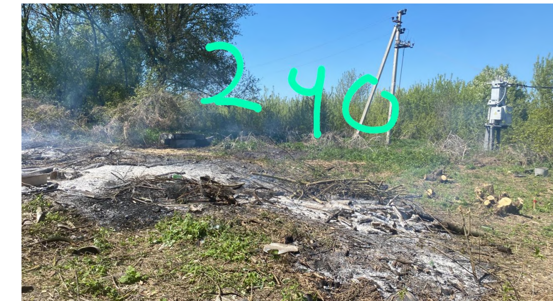
4. Писать кадастровый номер поверх снимка – грубая ошибка. Фото выглядит неэстетично, есть задымленность от подожженной травы.