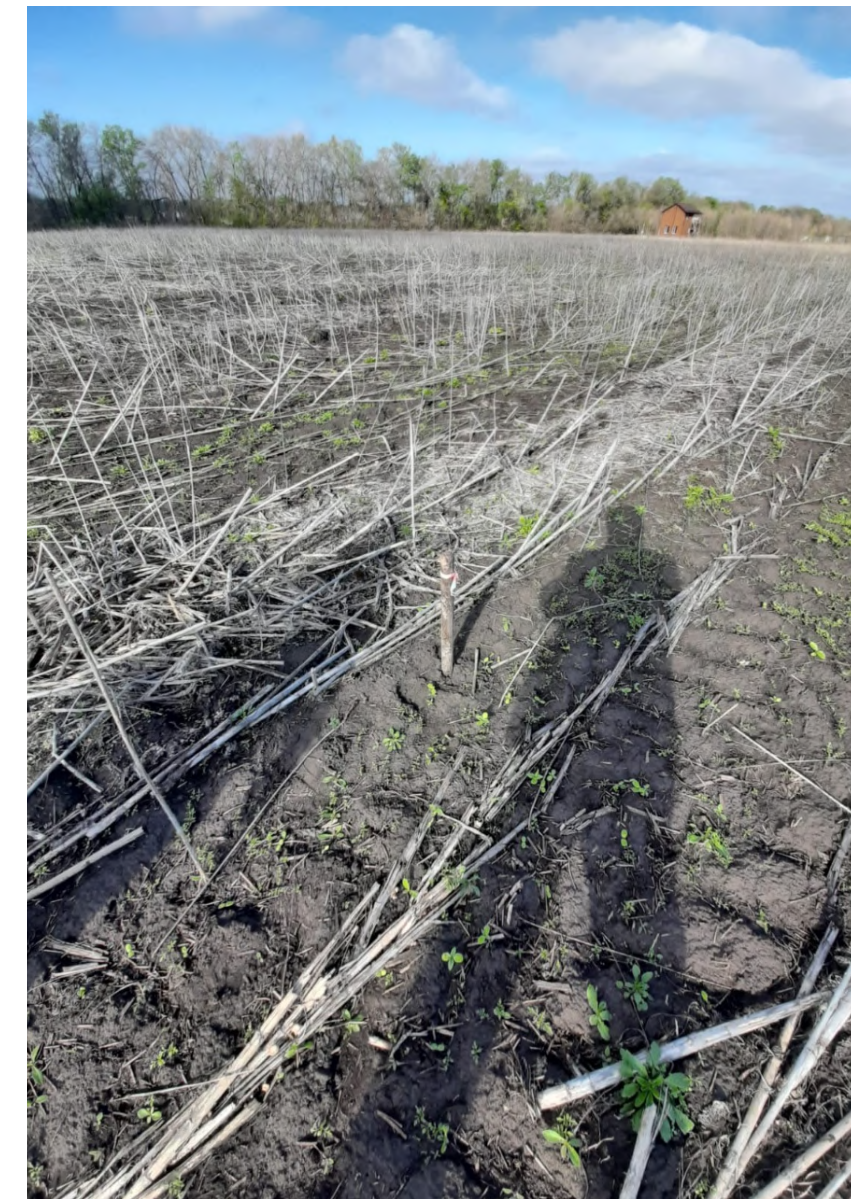
3. Вертикальный снимок, линия горизонта находится слишком высоко, тень фотографа занимает существенную часть кадра.