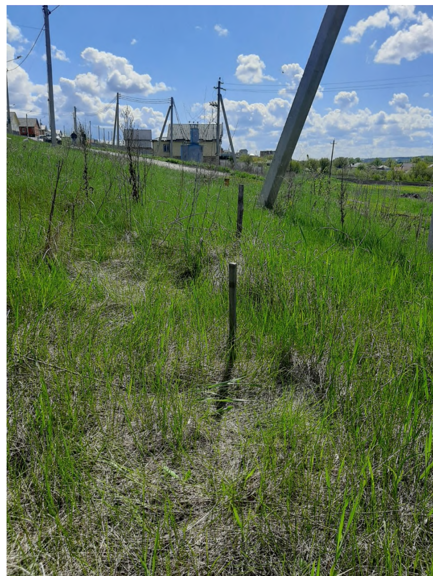
2. Вертикальный снимок, неудачный ракурс, множество лишних объектов, линия горизонта находится слишком высоко.