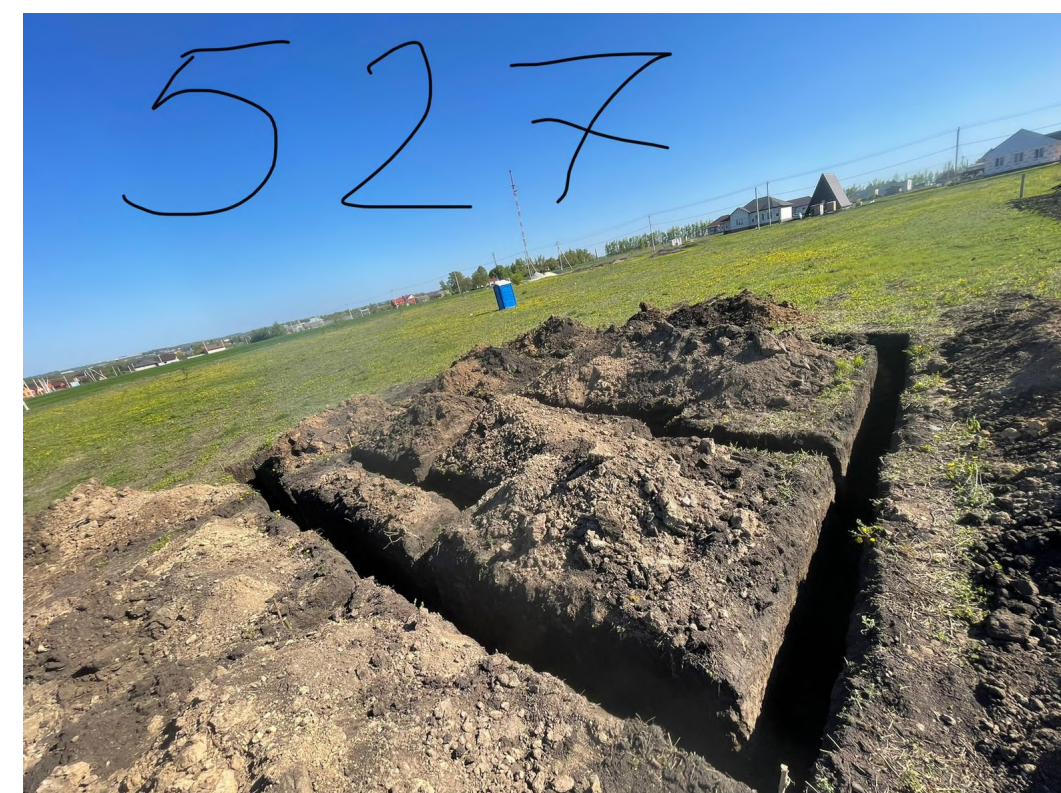
5. Линия горизонта сильно завалена, слишком близкое расстояние до объекта съемки. Ни в коем случае нельзя писать кадастровый номер поверх фотографии.